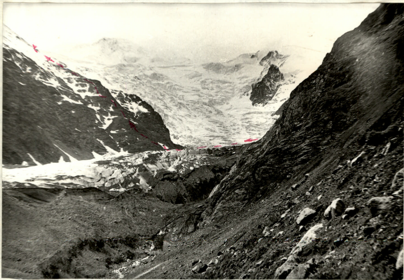
Рис. 3 СЕВЕРО. ЗАПАДНЫЙ ГРЕБЕНЬ. ПУТЬ ПОДЪЁМА-СПУСКА